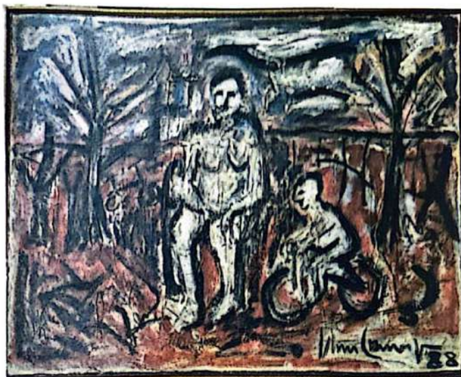
Artista Iberê Camargo Título Ciclista (com mulher sentada) Técnica Óleo sobre tela Ano 1988 Década 80 Dimensões 80cm x 115cm