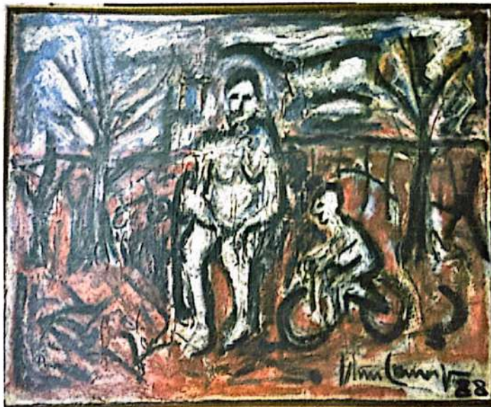
FIGURA 1 - Foto da obra

Trata-se de uma pintura a óleo sobre tela, medindo 80 cm de altura por 115 cm de largura, em estilo expressionista, retratando, ao centro da composição, uma pessoa sentada tendo à sua esquerda (direita da obra) uma criança andando de bicicleta, em um ambiente sombrio, de tons terrosos e escuros, com troncos de árvores desfolhadas em traços negros e rápidos, sendo duas à esquerda e obra e uma à direita. Uma bicicleta abandonada ao fundo, ondulações negras no céu carregado e uma cerca complementam a composição. Assinatura bem visível no canto inferior direito. Datada de 88.